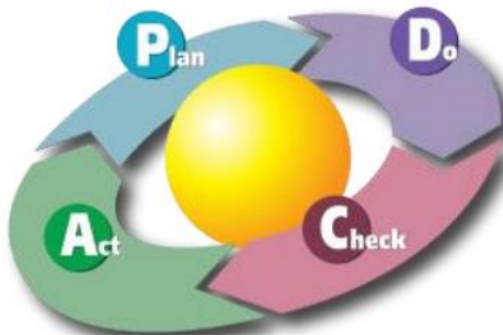
Figura 2. Creación de valor público

Así mismo, la gestión estratégica se estructura bajo el ciclo de planear, hacer, verificar y actuar. Dentro de este ciclo se deben tener en cuenta variables específicas como: qué, cómo y para qué se planeó; con qué recursos se ejecutará lo planeado; cómo se va a controlar lo ejecutado; con qué indicadores se medirán los resultados; qué acciones correctivas se tuvieron que tomar, entre otros.