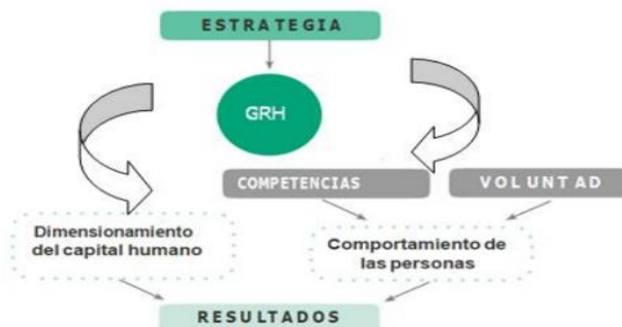
Figura 1. Creación de valor público