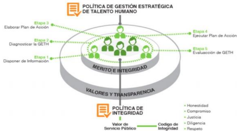
Figura 3. Dimensión Talento Humano MIPG