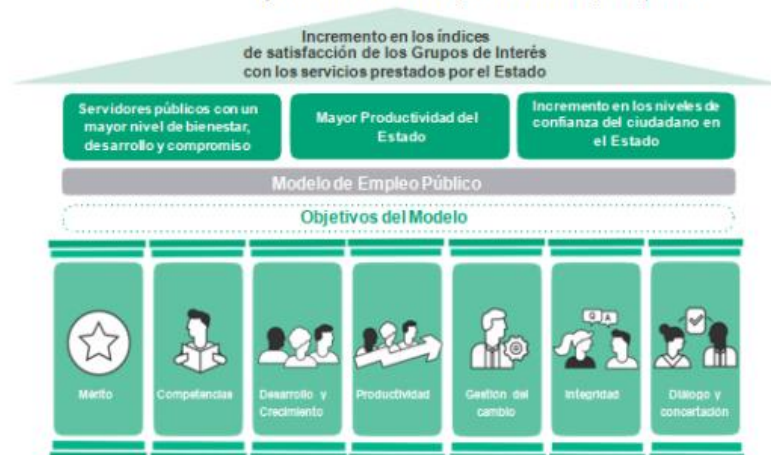
Figura 4. Marco de la política de empleo público

La estrategia de implementación de la política de GETH al articularse e integrarse al MIPG como la metodología que permitirá mejorar el eje central del modelo para propiciar el desarrollo y evolución de todos los temas que lo componen, tienen como propósito fundamental incrementar tanto la productividad del sector público como la calidad de vida de los servidores públicos. Esto genera resultados positivos en términos de bienestar para los ciudadanos y de eficacia en la prestación de los servicios del sector público. (DAFP, 2018).